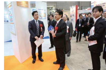
※ENEX/Smart Energy Japan/新電力EXPO2015開会式・内覧会の様子